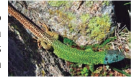
Lagarto verdinegro. ( Lacerta schreiberi ).

Si realiza este itinerario un día de lluvia, tenga precaución con estos pasos ya que pueden ser muy resbaladizos.