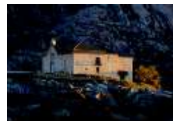
La Ermita de la Peña Sacra

La vegetación de Ribera se sitúa a lo largo del río, mostrando un gran contraste con las laderas de la garganta, a la vez muy diferentes entre sí: en la solana, muy rocosa, abunda la jara pringosa con su llamativa flor blanca en primavera y algún que otro enebro o encina dispersos. En la umbría, encontramos un bosque de repoblación con pinos y cipreses de Arizona.