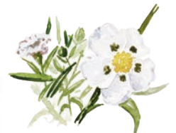
Jara pringosa ( Cistus ladanifer ).

En la umbría, encontramos un bosque de repoblación con pinos y cipreses de Arizona.