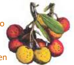
Fruto del madroño Arbutus unedo

La vegetación de Ribera se sitúa a lo largo del río, mostrando un gran contraste con las laderas de la garganta, a la vez muy diferentes entre sí: en la solana, muy rocosa, abunda la jara pringosa con su llamativa flor blanca en primavera y algún que otro enebro o encina dispersos. En la umbría, encontramos un bosque de repoblación con pinos y cipreses de Arizona.