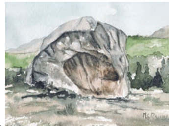
Bloque de El Tolmo.

Esta ruta asciende desde CANTO COCHINO hasta el COLLADO DE LA DEHESILLA, siguiendo el cauce de los arroyos de LA MAJADILLA y de LA DEHESILLA, permitiéndonos observar paisajes sorprendentes de LA PEDRIZA anterior y posterior.