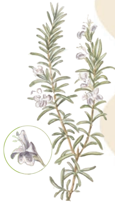
Romero ( Rosmarinus officinalis ).