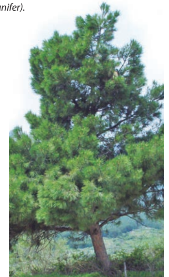
Pino resinero ( Pinus pinaster ).

Bandoleros como Pablo Santos, Luis Candelas, Paco el Sastre, la Banda de los Peseteros, etc., son protagonistas de innumerables leyendas localizadas en estos canchales, muy propios para el refugio de estos salteadores y malhechores de épocas pasadas.