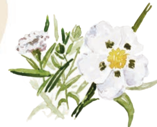
Jara pringosa ( Cistus ladanifer ).