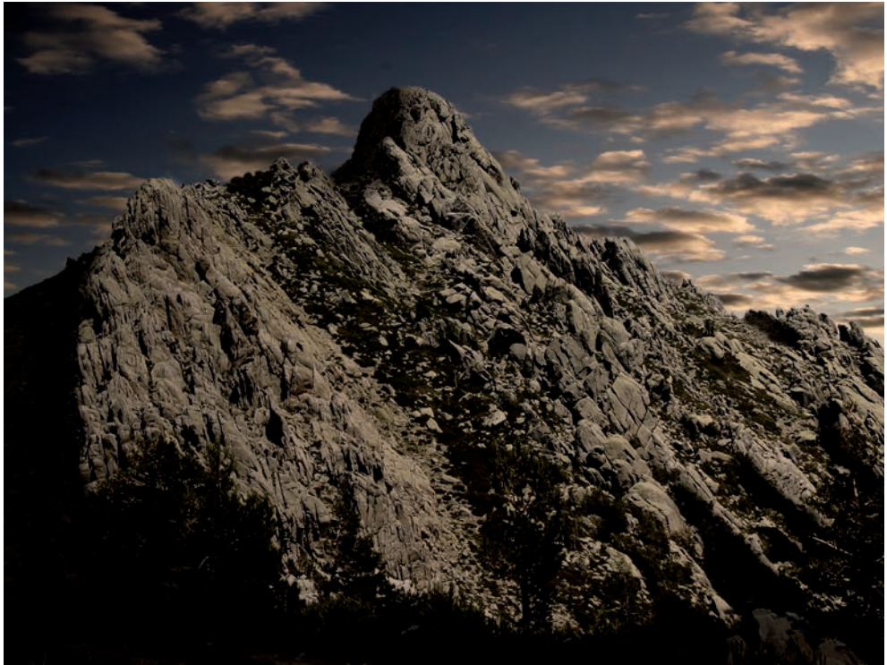
Las Torres de La Pedrizas (Pedrizas posteriores)